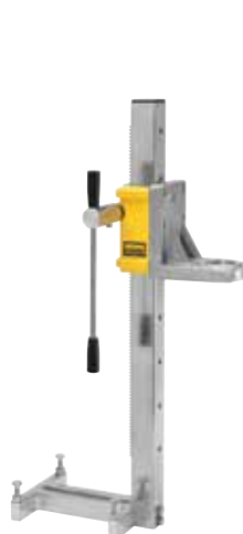
REMS Симплекс 2