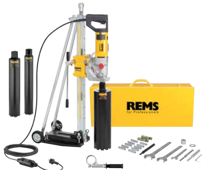
REMS Пикус S3 Сет 62-82-132 Титан