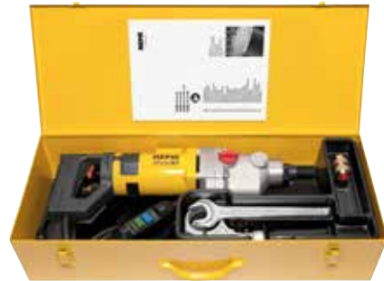
REMS Пикус S3 базовый пакет