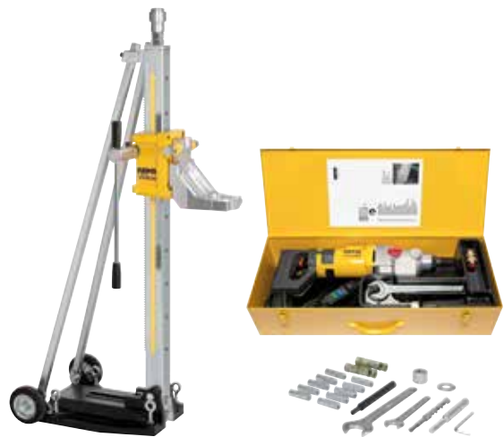
REMS Пикус S3 Сет Титан