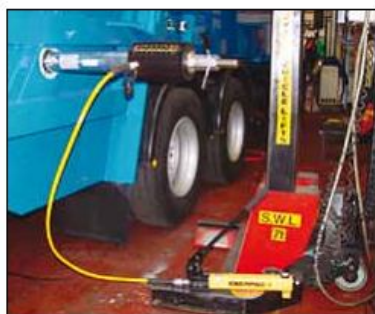
◀ RACH-306 с ручным насосом P-392 и используется для извлечения закорродированных осей из мусороборочной машины.