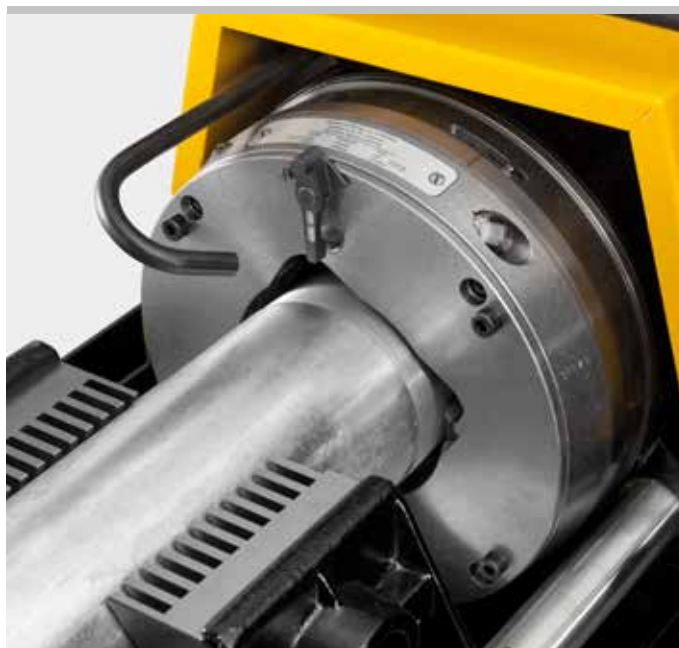
Продукция немецкого производства

Удобно использовать с автоматическим внутризажимным REMS Ниппельфикс \frac{1}{2} –4" или с ручным внутризажимным REMS Ниппельспанер \frac{3}{8} –2" (страница 48).